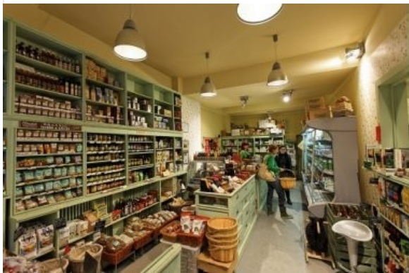
Afacerile bio sfideaza criza: cresc anual cu 20-30%

Moda "eco" nu mai este un moft in Romania. Pe masura ce oamenii constientizeaza importanta unei vietii sanatoase, conceptul prinde tot mai mult, dand nastere unor afaceri profitabile care se dezvoltă fara sa tina seama de criza economica. Chiar daca romanii au intrat de putin timp in randul cumparatorilor de produse "verzi", consumul a ajuns la aproape 90 de milioane de euro, piata inregistrand un trend pozitiv, cu o rata de crestere anuala de 20-30%